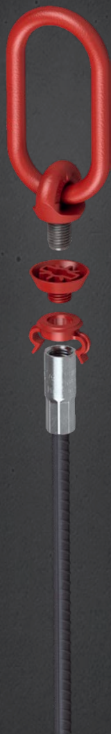
Beispiel: Typ RD 16