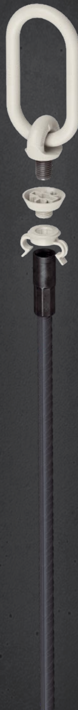
Beispiel: Typ SR 16